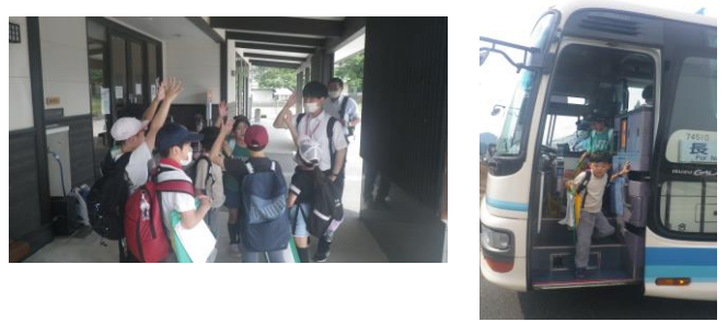
4年総合 水質検査事前学習 (6/15)