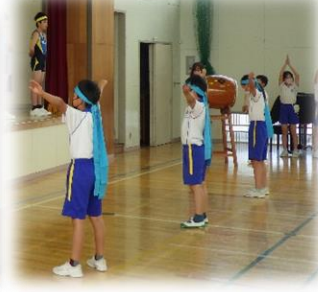
5年生がリードした応援

大会は天気が良く、暑い中での開催となりました。市内各校から選抜された選手が集まったの大会であり、一人ずつ選手が紹介されたり、競技途中の記録が発表されたりもする本格的な大会運営ですので、とても緊張していました。しかし、参加した全員が全力で競技に臨むことができ、自己ベストの記録がたくさん出ました。また、リレーでバトンが上手くつながるたびに、本沢小の選手待機場では全員がガッツポーズで声援を送り続け、一人一人の競技中も精一杯の応援をしました。6年生全員で支え合い、力を出し合うことができ、すばらしい大会になりました。多くの保護者の方にもご来場いただき、ご声援をいただきました。本当にありがとうございました。