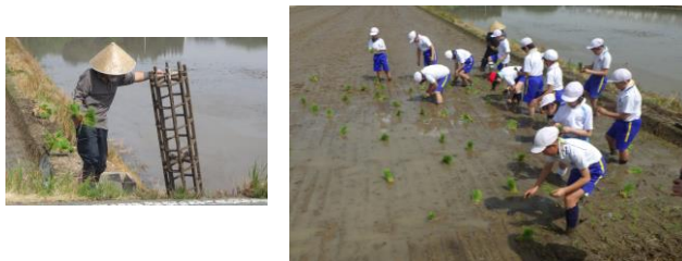
5年宿泊学習 (5月25・26日)