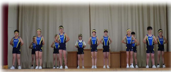
6年生が一人ずつ参加種目と目標を堂々と宣言しました！