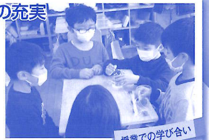
授業での学び合い