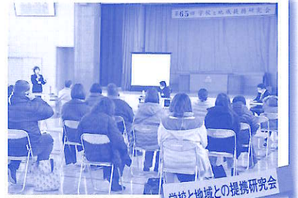
学校と地域との提携研究会